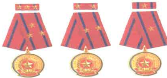
Huân chương lao động hạng nhất, nhì, ba

Qua hơn 35 năm xây dựng và phát triển, Công ty đã có những đóng góp cho sự phát triển của đất nước và đã được Nhà nước trao tặng Huân chương Lao động hạng Nhất, Nhì và Ba.